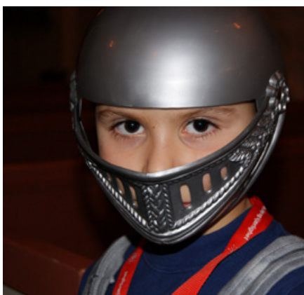
Klar til å innta klokketårnet.