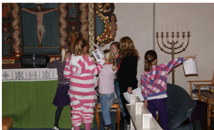
På jakt etter viktige ledetråder