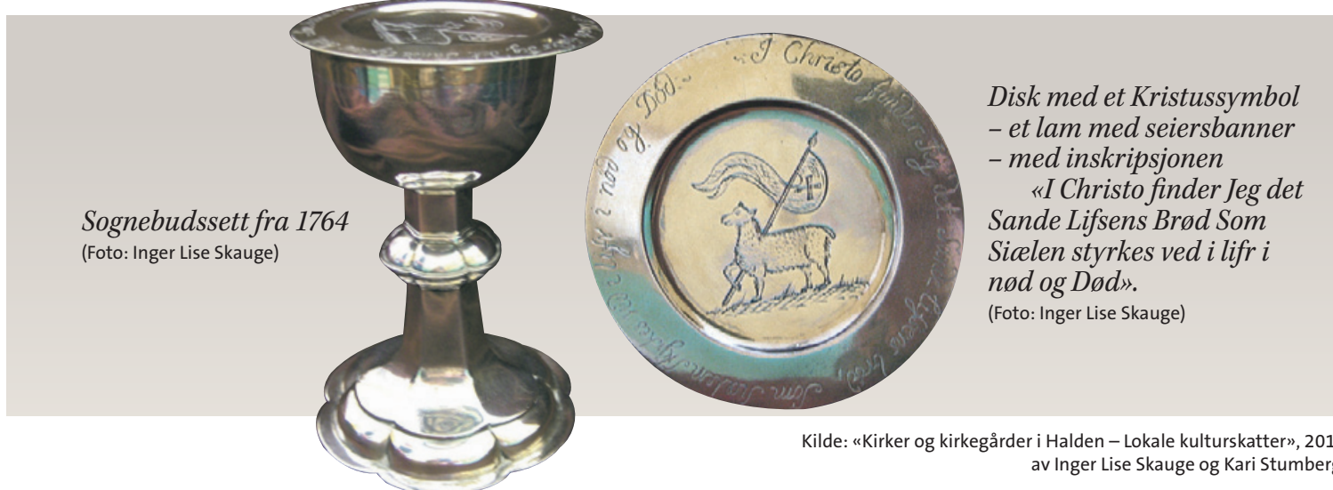
Sognebudssett fra 1764

I dag er vi vant til å skille mellom jødisk og kristen påskefeiring med vanntette skott. Kristen påske handler om Jesu død og oppstandelse, mens jødene feirer utgangen av Egypt.