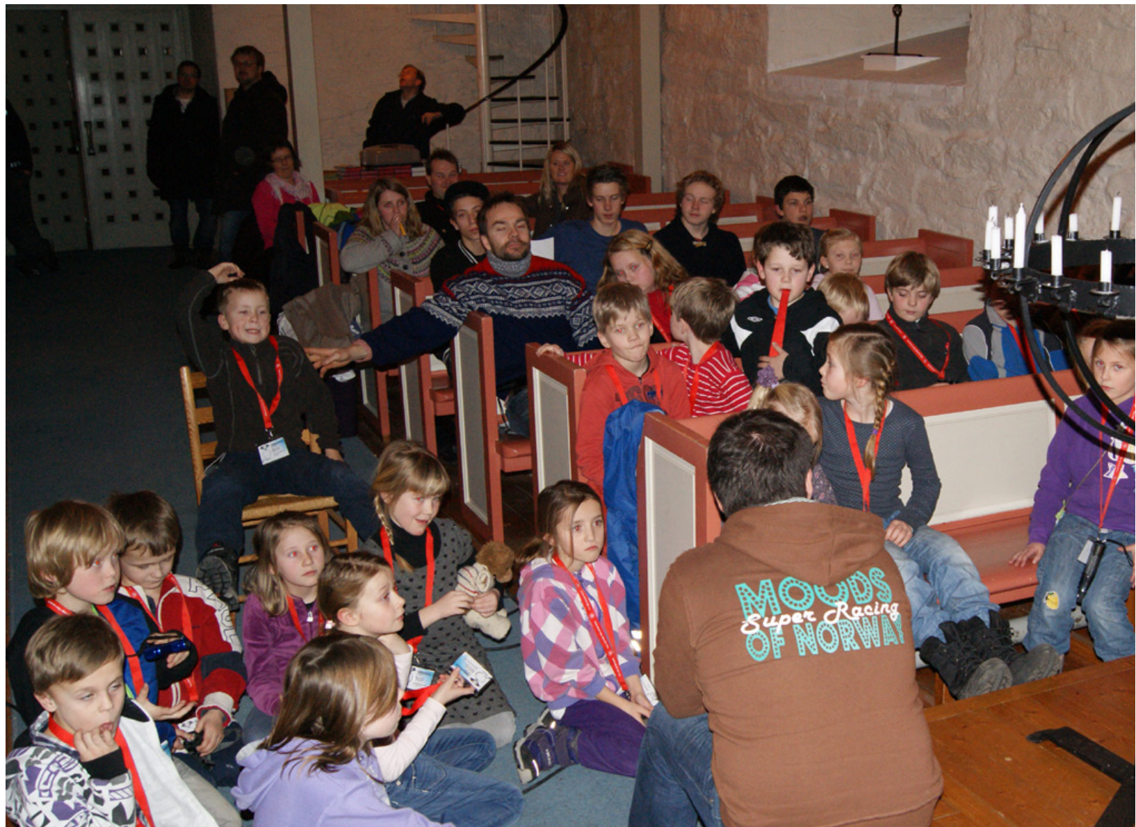
Ekstra spennende å være med på Tårnagenthelg. Kirketårn og kirkeklokker skulle utforskes nærmere.

Kirketårnet er en skjult skatt for mange barn. Det var ekstra spennende å få være med opp i tårnet og se på klokkene. Flere av klokkene er uvanlig rikt dekorert og kan ha ulike inskripsjoner. Det var tårnagentenes oppgave å finne ut hva som stod på deres kirkeklokke. Klokkene har også en flott klang og er som regel i C- eller G-dur. Flott var det også å synge en sang oppe i tårnet