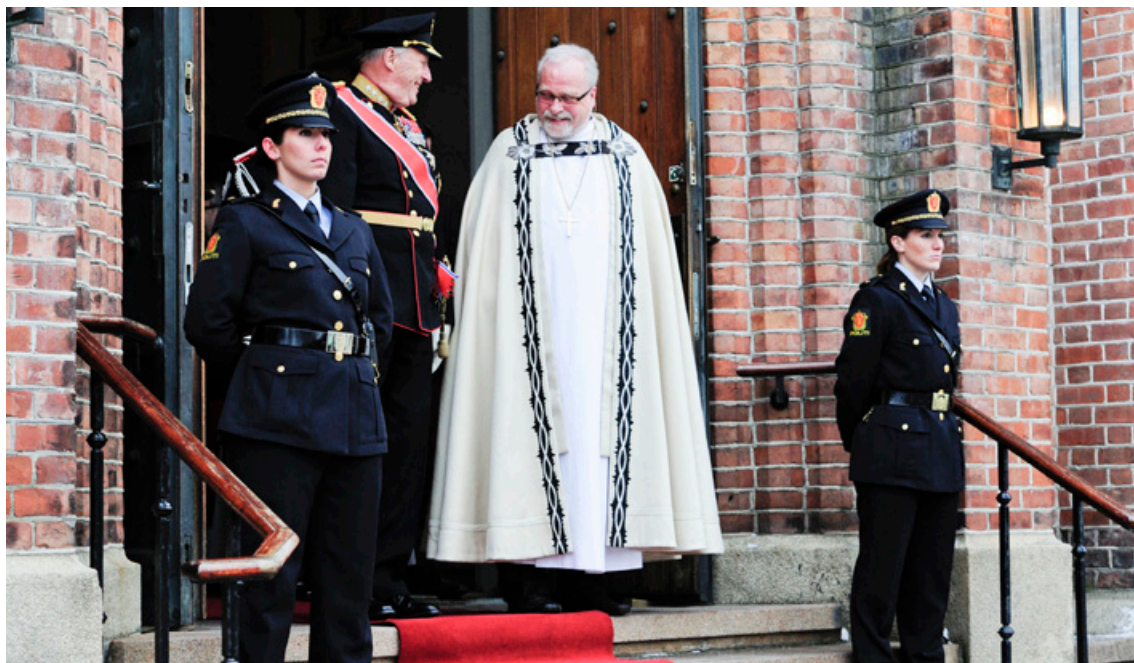
En hyggelig prat på kirketrappa mellom to av landets ledere, HMK Harald og nyslått biskop Sommerfeldt.