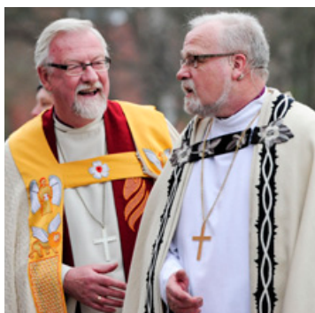
Kollega Ole Christian Kvarme var biskop i Borg fra 1998–2005.

og han syntes Sommerfeldts budskap om at kirken må bidra til å se de små og svake er et særdeles viktig budskap. Kongen var også opptatt av at