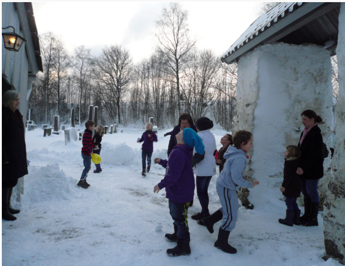
Det ble også tid til å være litt ute i det fine vinter været.